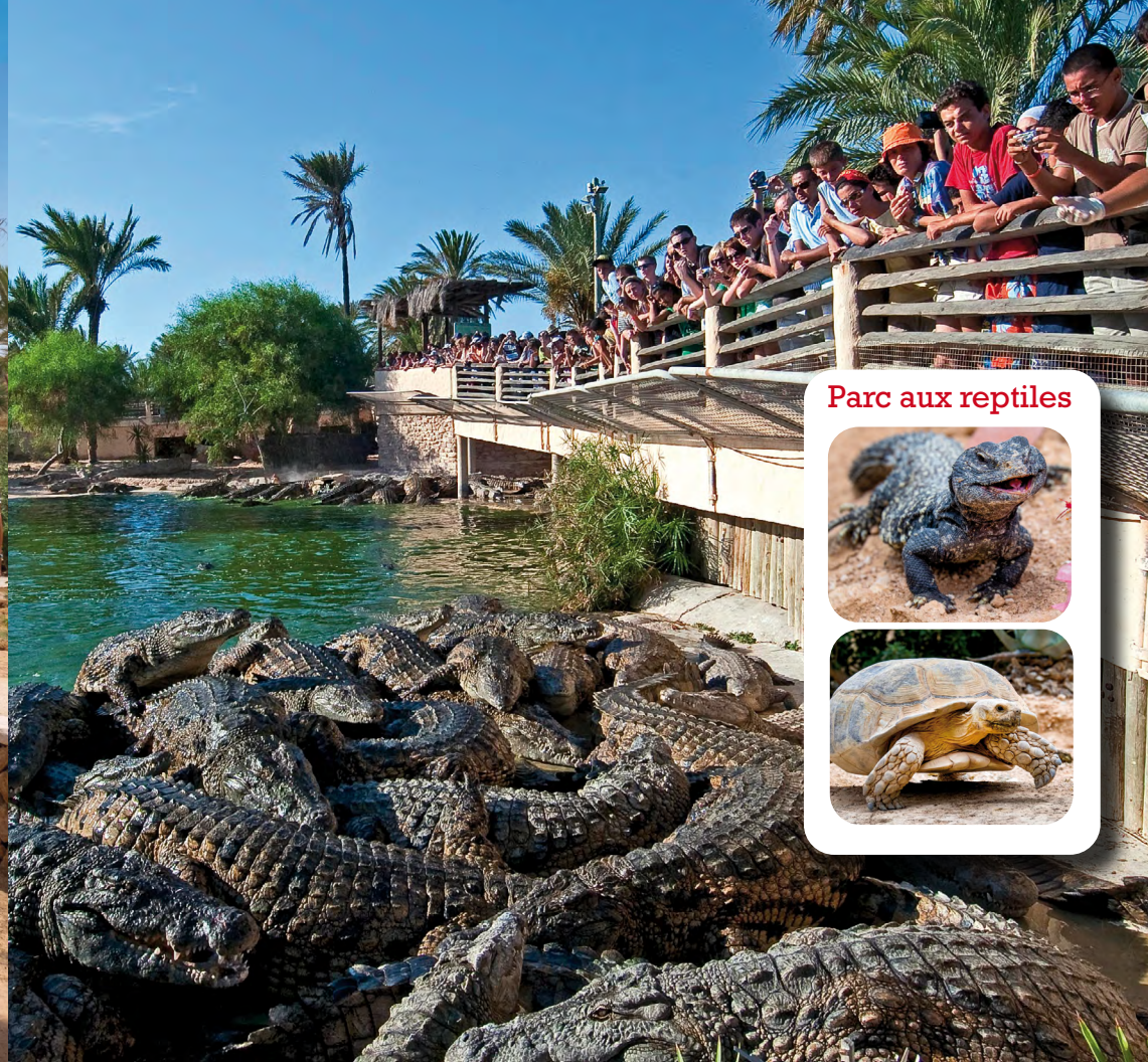
Parc aux reptiles